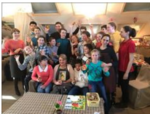
Тематический арт-терапевтический мастер-класс. Ребята из

тем фактом, что физическое состояние организма во многом определяется психологическим здоровьем.