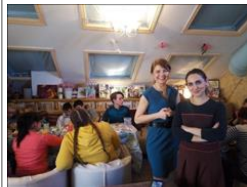
Тематический арт-терапевтический мастер-класс. Ребята из