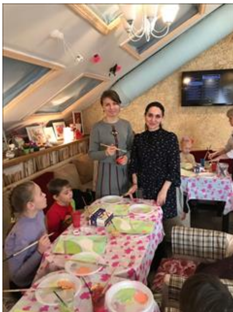
Тематический арт-терапевтический мастер-класс. Наши подопечные , ребята из Суздальского Реабилитационного Центра для Несовершеннолетних . Мастер класс тема : "Весна" мы рассуждали о рождении доброго начала в человеке , о мечтах , о жизни в целом , о трудностях , что они не навсегда. По сложившейся доброй традиции были угощения . На ребят очень благотворно влияют наши тёплые встречи , мы их находим эффективными и важными , и прослеживаем положительную динамику , психологического состояния детей.

тем фактом, что физическое состояние организма во многом определяется психологическим здоровьем.