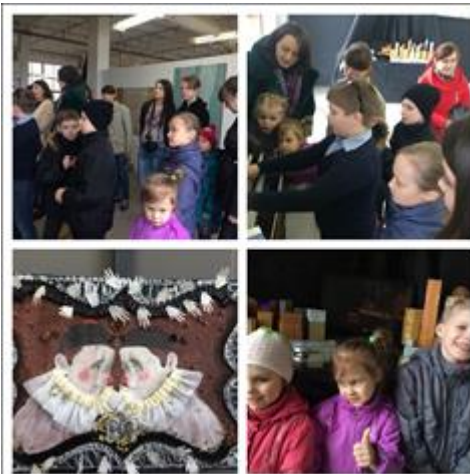
Грандиозный Владимирский фестиваль Арт-Субъект.

Что является задачей жизни человека, в чем ее смысл, как выбрать жизненный путь, к каким целям стремиться. Что входит в цели и задачи человека на каждом этапе его жизни. Что нужно человеку для счастья в тот или другой жизненный период? Важность выбора на том или ином этапе его жизни.